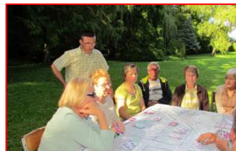
Jeux de cartes et de boules dans l'après midi