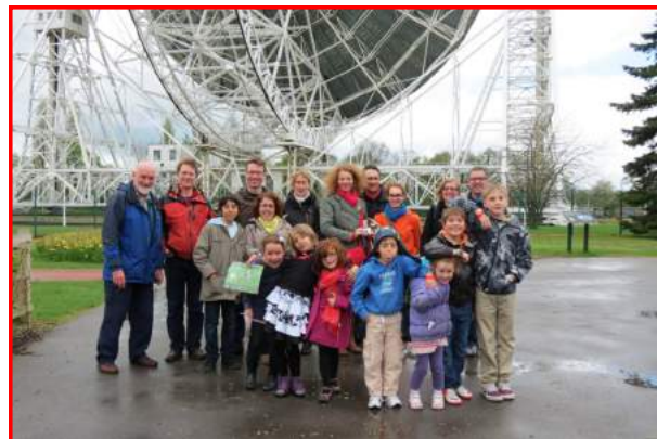
Visite du centre de radio astronomie de Jodrell Bank pour quelques familles.