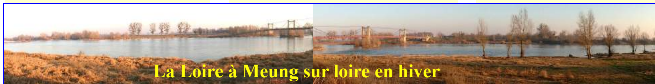
La Loire à Meung sur loire en hiver