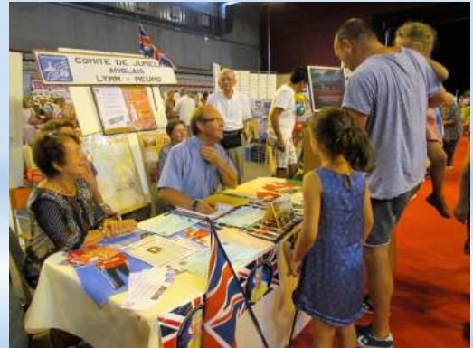
Assemblée Générale du 22 Janvier 2017