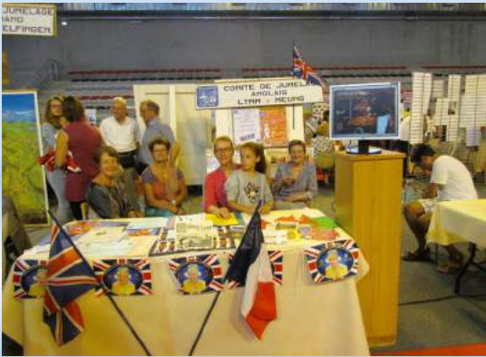
Assemblée Générale du 22 Janvier 2017