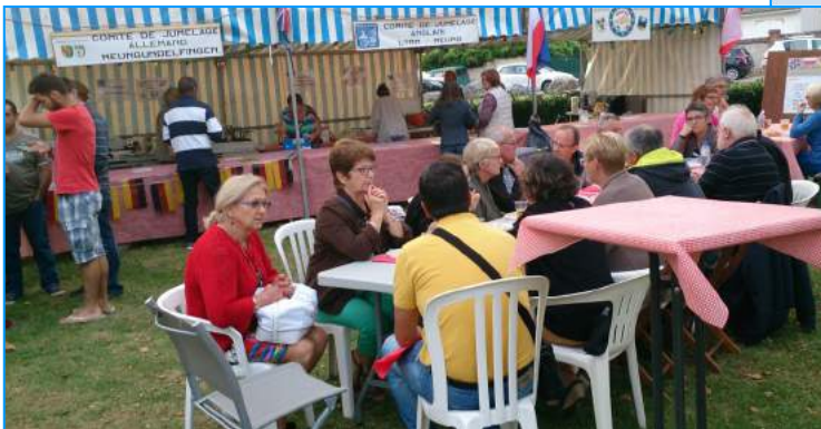
Dégustation de « bigos » devant le stand des jumelages.