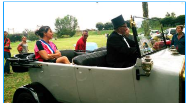
Madame le Maire avec son chauffeur et sa voiture d'époque.