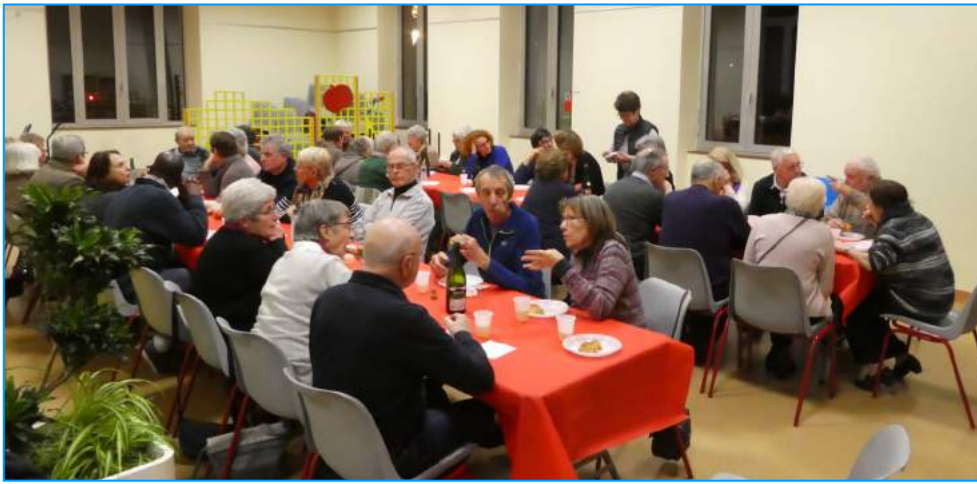
La traditionnelle galette qui clôture l'assemblée générale.