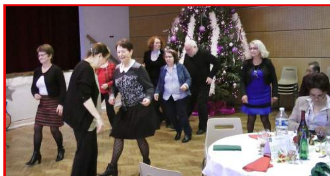
L'animation musicale était assurée par les « Hobby Blues ».